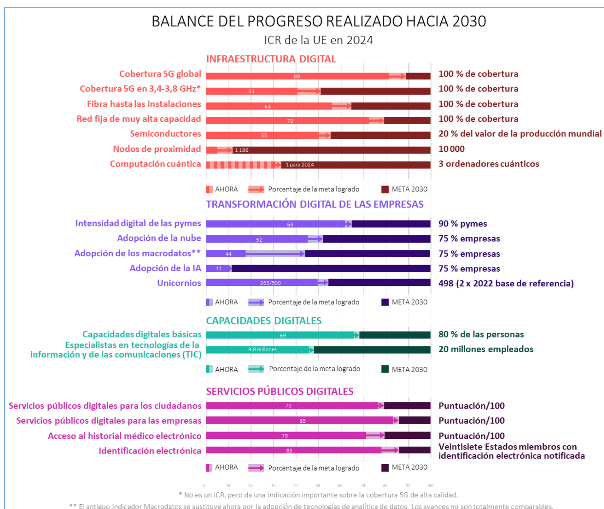
Gráfico 1. Balance del progreso realizado hacia las metas de la Década Digital fijadas para 2030 3

Por primera vez, este informe incluye una evaluación de las hojas de ruta estratégicas nacionales para la Década Digital . Sobre esta base, esboza la contribución individual de los