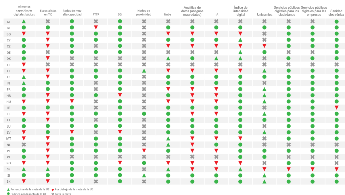
Gráfico 3. Comparación de las metas nacionales para 2030 con las metas de la UE

Un análisis del esfuerzo colectivo basado en hojas de ruta en relación con la consecución de las metas (véase el cuadro 2) muestra que, en el escenario actual, los esfuerzos colectivos de los Estados miembros no alcanzan el nivel de ambición de la UE en al menos ocho de los doce indicadores clave de rendimiento.