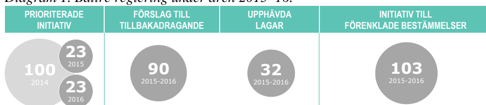
Diagram 1. Bättre reglering under åren 2015–16.

Samtidigt har kommissionens förslag till förordningar och direktiv som ska antas av Europaparlamentet och rådet enligt det ordinarie lagstiftningsförfarandet minskat från 159 under 2011 till 48 under 2015. Sedan 2000 har antalet direktiv och förordningar som antagits av Europaparlamentet och rådet enligt det ordinarie lagstiftningsförfarandet varierat varje år, med det högsta antalet år 2009 (141). Under Junckerkommissionens första år 2015 antogs 56 rättsakter.