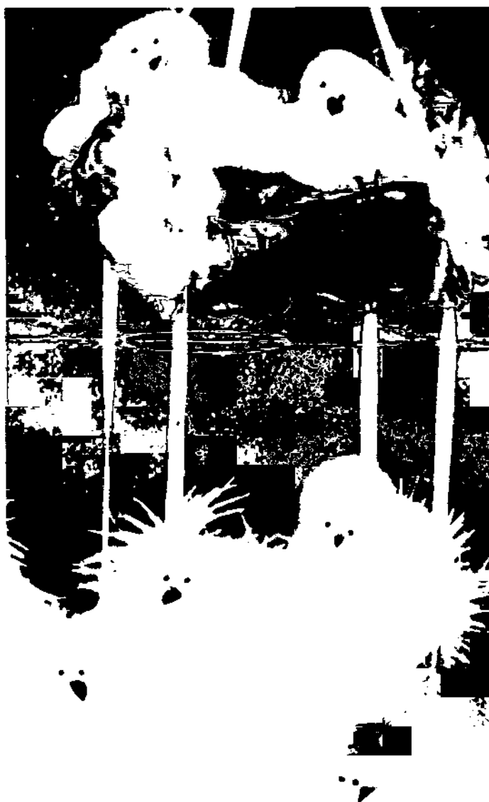
Exempel nr 4