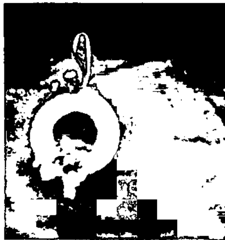
Exempel nr 3