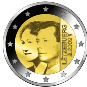
Národná strana novej dvojeurovej pamätnej obehovej mince vydanej Luxemburskom

Obehové euromince majú v celej eurozóne štatút zákonného platidla. Komisia zverejňuje vzory všetkých nových euromincí s cieľom informovať verejnosť a všetkých, kto prichádza s mincami do kontaktu (1) . V súlade so závermi Rady z 8. decembra 2003 (2) členské štáty eurozóny a krajiny, ktoré so Spoločenstvom uzavreli menovú dohodu ustanovujúcu vydávanie obehových euromincí, môžu vydať do obehu určité množstvo pamätných obehových euromincí pod podmienkou, že krajina nevydá viac ako jeden nový vzor pamätnej mince ročne, a minca bude v nominálnej hodnote 2 eur. Pamätné mince majú rovnaké technické parametre ako bežné obehové euromince, na národnej strane je však zobrazený pamätný vzor.