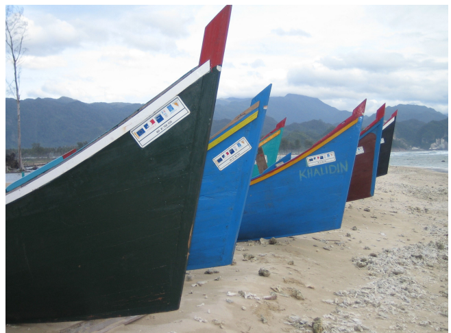
Pomoc so živobytím: rybárske lode v Acehu, Indonézia

21. Hodnotenie potrieb v projektoch po februári 2005 bolo spoľahlivejšie vďaka dostupnosti viacerých informácií a dlhšiemu času na prípravu návrhov. Napríklad pri príprave projektu stavania lodí v Acehu mimovládna organizácia úzko spolupracovala s komunitou a úspešne navrhla projekt, ktorý pokryl potreby príjemcov.