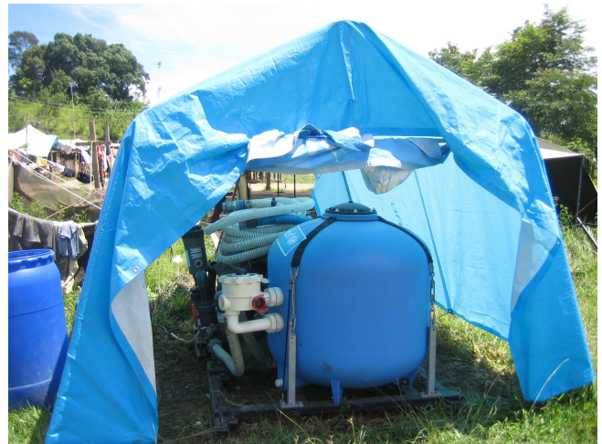
Čistička vody v Acehu, Indonézia

39. Naším auditom sa taktiež potvrdili monitorovacie správy GR ECHO, ktoré zastáva názor, že viditeľnosť činností financovaných GR ECHO je vo všeobecnosti uspokojivá, hoci v niektorých prípadoch existuje priestor na zlepšenie. Napríklad GR ECHO bolo nedostatočne zviditeľnené v centre starostlivosti o deti v Janthe, Aceh, a pri projekte čističiek vody, ktorý realizovala agentúra OSN. V počiatočných zisteniach analýzy celkovej medzinárodnej pomoci, ktorú vykonala Koalícia na hodnotenie cunami, sa kriticky hodnotia humanitárne organizácie, ktoré sa zameriavali na propagáciu vlastnej značky a súťažili o zviditeľnenie na úkor pokrytia skutočných potrieb príjemcov. Snaha o zviditeľnenie však má dodatočný prínos v tom, že pomáha znížiť riziko dvojitého financovania tým, že sa zreteľne oznámi, kto a čo financoval.