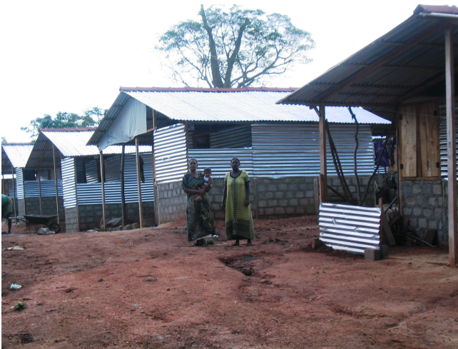
Pomoc bezdomovcom: prístrešia na Srí Lanke

Udržateľnosť projektu mimovládnej organizácie v Indonézii sa podporuje tak, že väčšinu činností v táborech organizujú členovia komisie na dobrovoľnej báze.