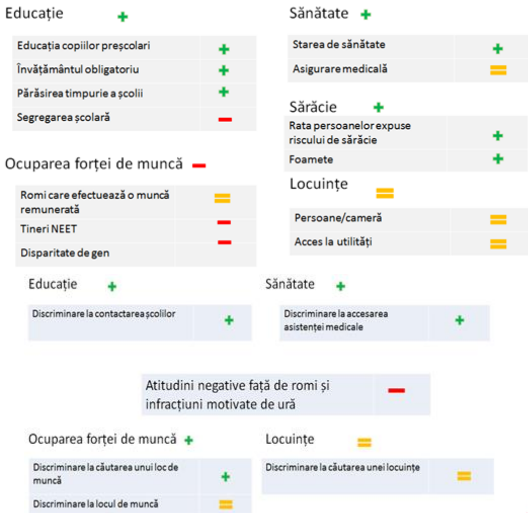
Graful 2: Evoluții în perioada 2011-2016 în ceea ce privește situația romilor în domeniile de politică: sărăcie, discriminare pe domenii și atitudini negative față de romi