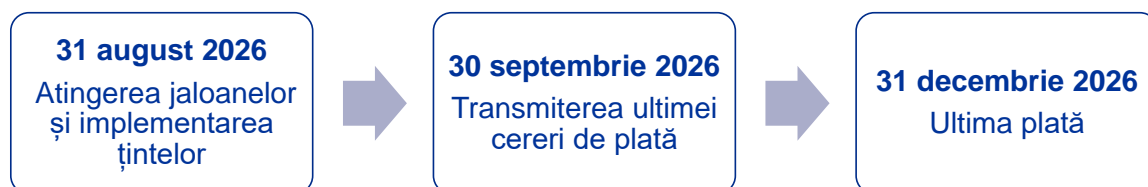
Figura 3: Calendarul încheierii MRR

cererile de plată, inclusiv declarațiile de gestiune, rezumatele auditurilor efectuate (18) și toate dovezile necesare pentru evaluarea acestora, trebuie prezentate până la 30 septembrie 2026 (19) . Comisia va evalua apoi îndeplinirea satisfăcătoare a jaloanelor și a țintelor incluse în ultimele cereri de plată, în conformitate cu cadrul de evaluare a jaloanelor și a țintelor în temeiul Regulamentului privind MRR, publicat la 21 februarie 2023 (20) . Toate plățile trebuie efectuate până la 31 decembrie 2026 (21) .