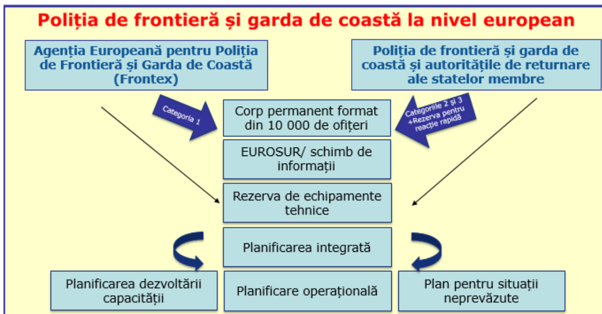
Figura 2: Poliția de frontieră și garda de coastă la nivel european

Comisia are, de asemenea, un rol operațional în ceea ce privește unele aspecte ale punerii în aplicare a GEIF, în special în ceea ce privește finanțarea din partea UE, mecanismul de evaluare Schengen și coordonarea cooperării interinstituționale în hotspoturi. Regulamentul privind Poliția de frontieră și garda de coastă la nivel european subliniază, de asemenea, importanța altor părți interesate europene , în special a agențiilor descentralizate ale UE [eu-LISA, Europol, Agenția Uniunii Europene pentru Azil și Agenția pentru Drepturi Fundamentale a Uniunii Europene (FRA)]. Cooperarea strânsă a acestor părți interesate cu