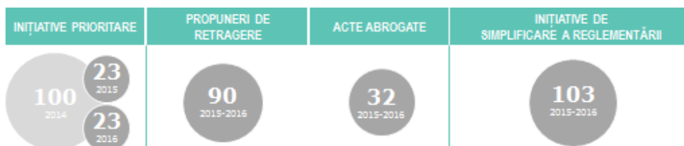
Graficul 1. O mai bună legiferare, în cifre (2015-2016)

În același timp, numărul propunerilor de regulamente și de directive prezentate de Comisie Parlamentului European și Consiliului în vederea adoptării în conformitate cu procedura legislativă ordinară a scăzut de la 159 în 2011 la 48 în 2015. Începând cu 2000, numărul de directive și regulamente adoptate de Parlament și Consiliu în cadrul procedurii legislative ordinare a variat anual, în 2009 producția legislativă atingând un nivel maxim, de 141 de acte legislative. În 2015, primul an de mandat al Comisiei Juncker, au fost adoptate 56 de acte legislative.