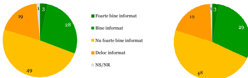
Î2. Cât de bine informat considerați că sunteți cu privire la drepturile pe care le aveți în calitate de cetățean al Uniunii Europene? Bază: toți respondenții, % UE27

Pentru ca cetățenia UE să dobândească o semnificație reală în viața oamenilor, este necesar ca aceștia să își cunoască mai bine drepturile și responsabilitățile.