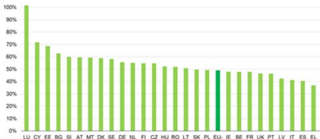
Gráfico 1. Receitas efetivas de IVA em 2011 (percentagem das receitas teóricas à taxa normal)

A razão da receita do IVA é o resultado da divisão das receitas do IVA efetivamente cobradas pelo produto do IVA à taxa normal e do consumo doméstico final líquido. O elevado valor do Luxemburgo explica-se pela importância da coleta do IVA nas vendas a não-residentes.