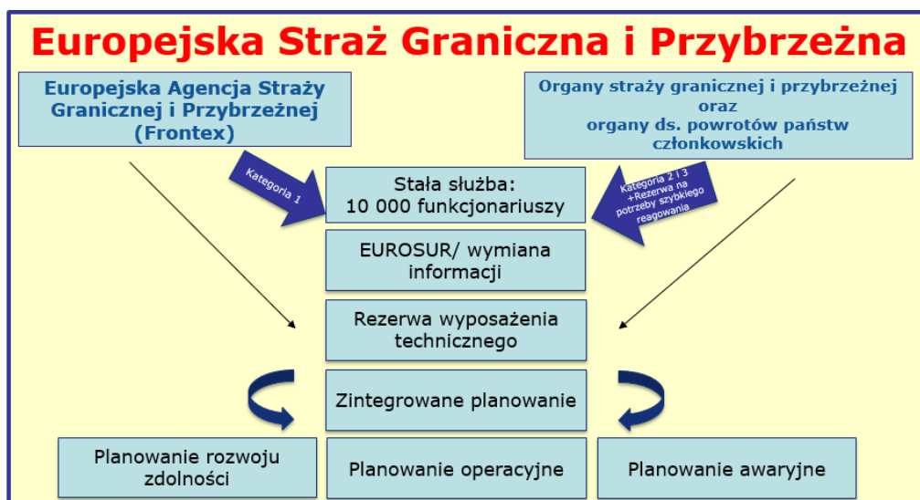
Rysunek 2: Europejska Straż Graniczna i Przybrzeżna

Komisja odgrywa również rolę operacyjną w odniesieniu do niektórych aspektów realizacji EUIBM, w szczególności w odniesieniu do finansowania unijnego, mechanizmu oceny Schengen oraz koordynacji współpracy międzyagencyjnej w hotspotach. W rozporządzeniu w sprawie Europejskiej Straży Granicznej i Przybrzeżnej podkreślono również znaczenie