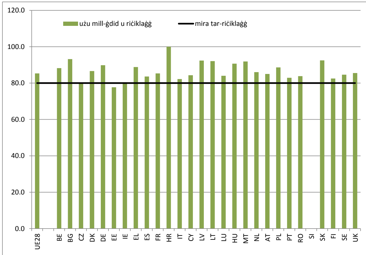
Figura 1: Ir-rati ta' użu mill-ġdid/ta' riċiklaġġ irrapportati għall-2013

Sa mhux aktar tard mill-2006, l-Istati Membri kienu meħtieġa jilħqu r-rata ta' użu mill-ġdid u ta' riċiklaġġ ta' 80 % u l-mira ta' użu mill-ġdid u ta' rkupru ta' 85 % stabbiliti fl-Artikolu 7(2) tad-Direttiva dwar l-ELV. Ir-rati tal-2013 irrapportati mill-Istati Membri huma murija fil-Figura 1 14 . Il-mira għall-użu mill-ġdid u għar-riċiklaġġ intlaħqet mill-Istati Membri kollha hlief mill-Estonja, li rrapportat rata ta' użu mill-ġdid/ta' riċiklaġġ ta' 78 % iżda kienet laħqet il-mira fl-2012. Il-mira ta' użu mill-ġdid u ta' rkupru ntlahqet ukoll mill-pajjiżi kollha hlief mill-Italja, li laħqet 83 %.