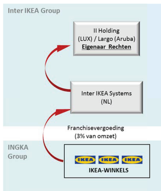
Figuur 1 – Exploitatie IKEA-activiteiten tot en met 2011 volgens de APA van 2006