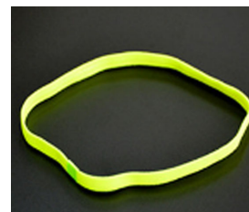
3. Fascia fermacapelli