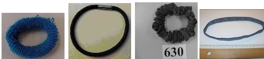
1. Elastico per capelli 2. Elastico per capelli 3. Elastico per capelli 4. Fascia fermacapelli