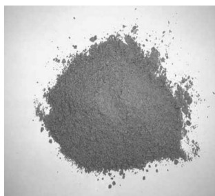
2. számú fénykép