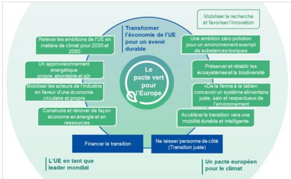
Graphique 1. Le plan d'investissement au sein du pacte vert pour l'Europe

Le plan d'investissement pour une Europe durable permettra d'accomplir la transition vers une économie verte et neutre pour le climat selon les trois axes suivants: