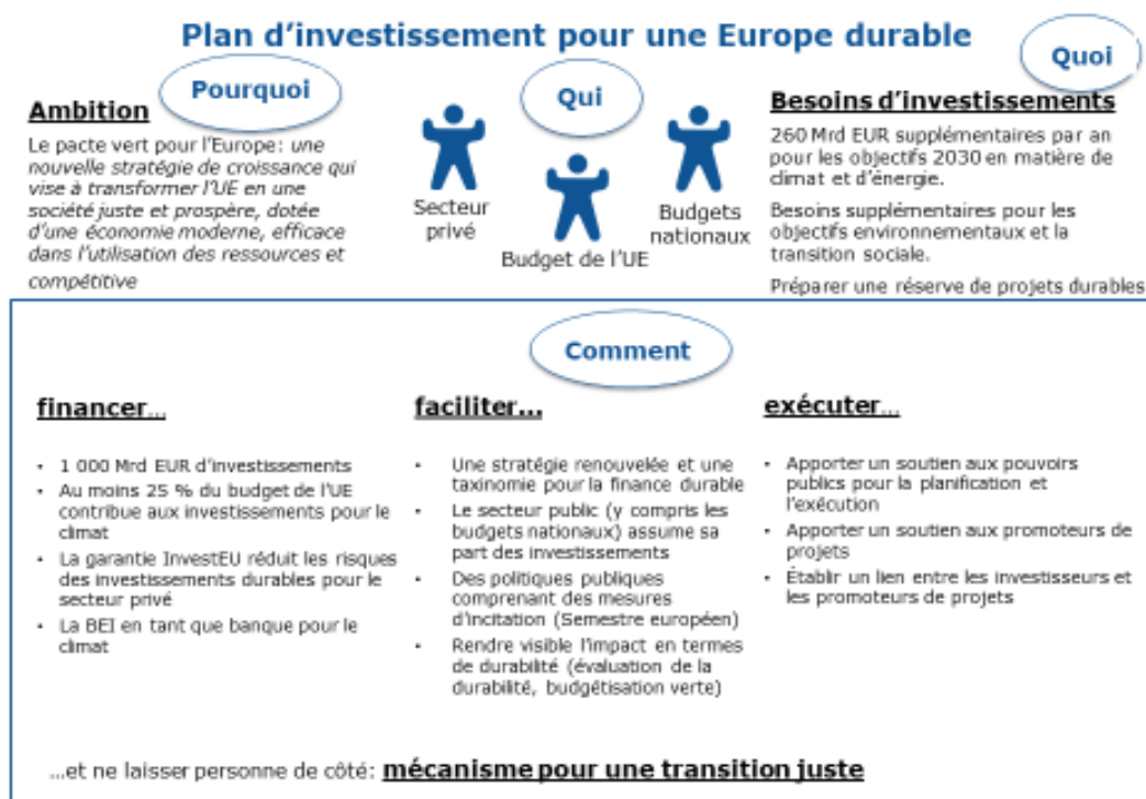
Graphique 2. Le plan d'investissement pour une Europe durable

Le plan d'investissement pour une Europe durable contribue à la réalisation des objectifs de développement durable. Cela correspond à l'engagement pris dans la communication relative au pacte vert pour l'Europe de placer les objectifs de développement durable au centre de l'élaboration des politiques de l'UE et de l'action de celle-ci.