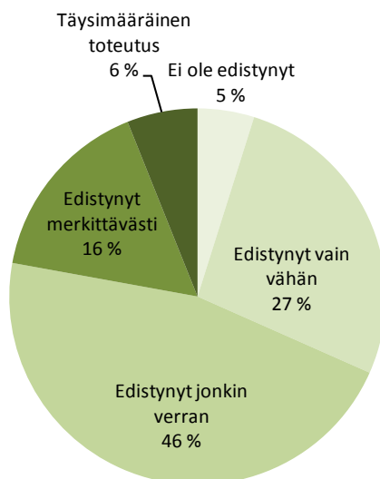
Kuvio 1: Vuosien 2011–2019 maakohtaisten suositusten toteuttaminen tähän mennessä

Huom. Monivuotisessa arvioinnissa tarkastellaan suositusten toteuttamista alkaen siitä, kun hyväksyttiin, tämän tiedonannon julkaisemiseen toukokuussa 2020. Finanssipolitiikkaan liittyvien maakohtaisten suositusten toteuttamista koskevaan kokonaisarvioon sisältyy vakaus- ja kasvusopimuksen noudattaminen.