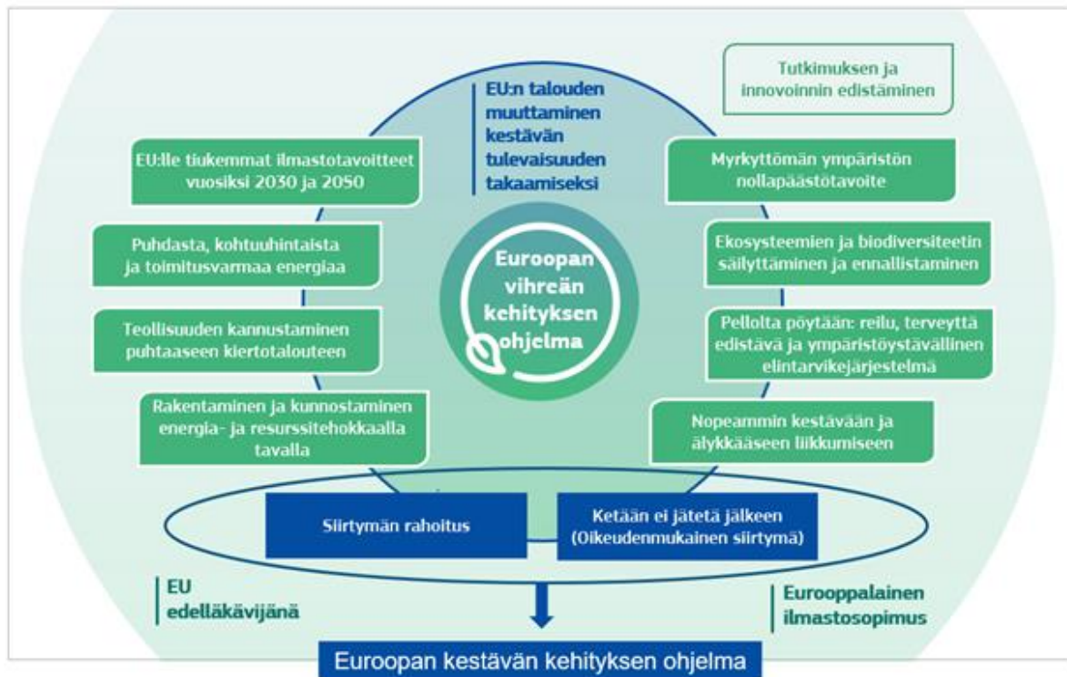
Kuvio 1. Investointiohjelman rooli Euroopan vihreän kehityksen ohjelmassa

Kestävä Eurooppa -investointiohjelma mahdollistaa siirtymän ilmastoneutraaliin ja vihreään talouteen kolmella tavalla: