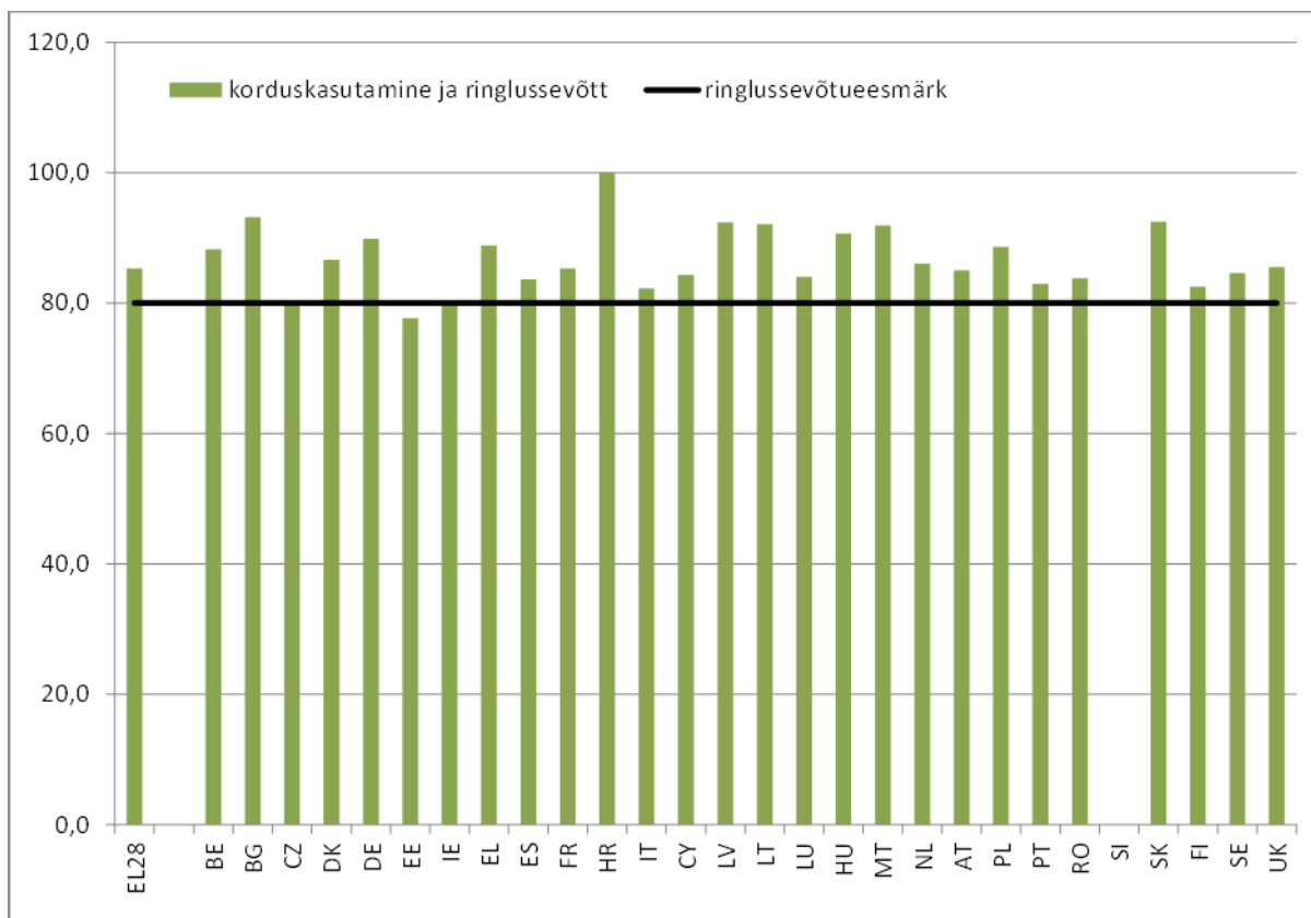
Joonis 1. Teatatud 2013. aasta korduskasutamise/ringlussevõtu määrad.

Liikmesriigid pidid hiljemalt 2006. aastaks saavutama kasutuselt kõrvaldatud sõidukite direktiivi artikli 7 lõikes 2 sätestatud 80 % korduskasutamise ja ringlussevõtu määra ning 85 % korduskasutamise ja taaskasutamise määra. Liikmesriikide teatatud 2013. aasta määrad on esitatud joonisel 1 14 . Korduskasutamise ja ringlussevõtu eesmärgi saavutasid kõik liikmesriigid peale Eesti, kes teatas 78 % korduskasutamise/ringlussevõtu määrast, kuid oli täitnud eesmärgi 2012. aastal. Ka korduskasutamise ja taaskasutamise eesmärgi saavutasid kõik liikmesriigid, välja arvatud Itaalia, kelle saavutatud määr oli 83 %.