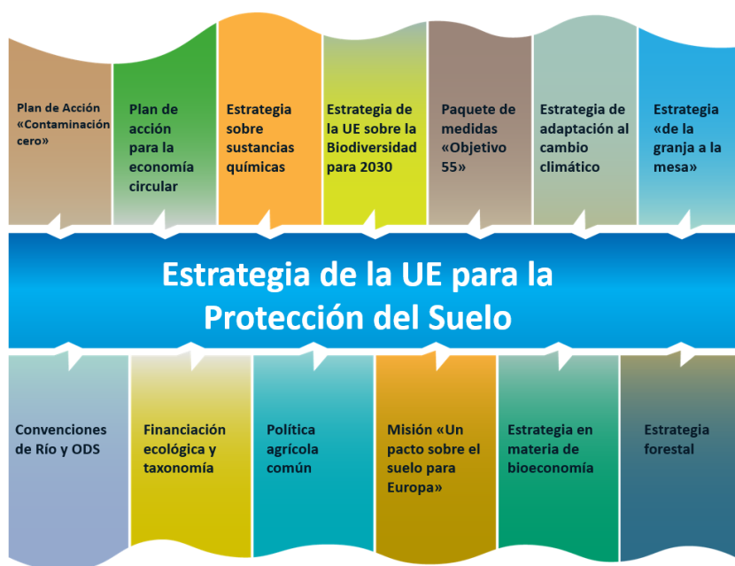
Gráfico 1: vínculos entre la Estrategia de la UE para la Protección del Suelo y otras iniciativas de la UE