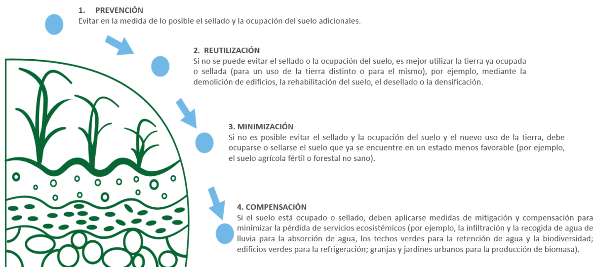
Gráfico 2: Jerarquía de la ocupación de suelo