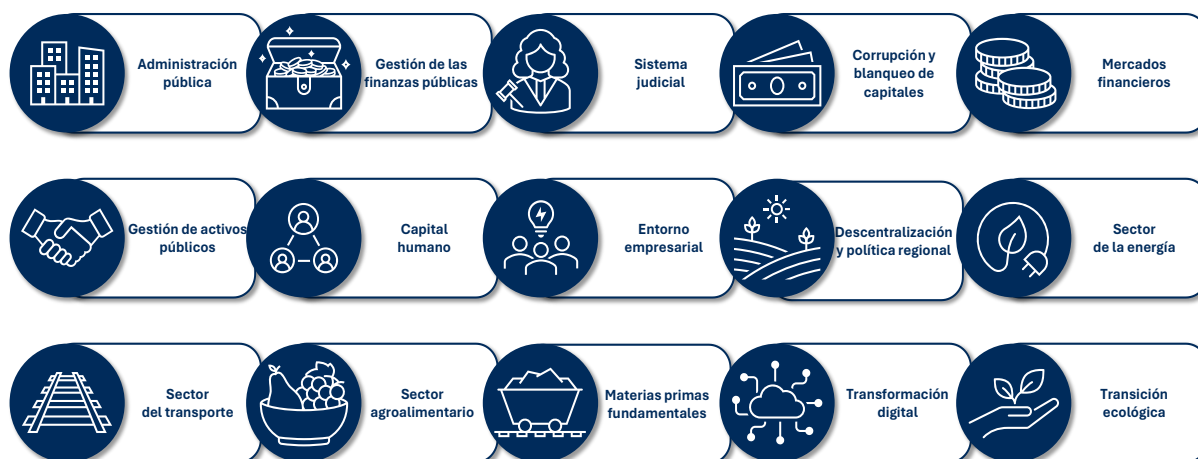
Gráfico 1: Capítulos del Plan para Ucrania

En la Decisión de Ejecución del Consejo relativa a la aprobación de la evaluación positiva de la Comisión del Plan para Ucrania, se establece un calendario con condiciones (es decir, indicadores cualitativos y cuantitativos) que Ucrania debe cumplir cada trimestre, hasta el cuarto trimestre de 2027. Estas condiciones reflejan los avances realizados en las inversiones y reformas propuestas por Ucrania en el Plan.