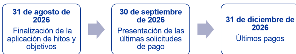
Gráfico 3: Calendario de la finalización del MRR

de agosto de 2026 para cumplir los hitos y objetivos no pueden tenerse en cuenta en la evaluación de las solicitudes de pago. Esto también se aplica a las medidas adoptadas para garantizar el cumplimiento satisfactorio de los hitos y objetivos cubiertos por decisiones de suspensión adoptadas antes del 31 de agosto de 2026 e impide el inicio de nuevos procedimientos de suspensión después de esa fecha. Además, esto significa que no hay margen para adoptar modificaciones de los PRR después del 31 de agosto de 2026. Todas las solicitudes de pago, incluidas las declaraciones de gestión, los resúmenes de las auditorías realizadas 18 y todas las pruebas necesarias para su evaluación, deberán presentarse a más tardar el 30 de septiembre de 2026 19 . A continuación, la Comisión evaluará el cumplimiento satisfactorio de los hitos y objetivos incluidos en las últimas solicitudes de pago en consonancia con el Marco para evaluar los hitos y objetivos en el contexto del Reglamento del MRR, publicado el 21 de febrero de 2023 20 . Todos los pagos deberán efectuarse a más tardar el 31 de diciembre de 2026 21 .