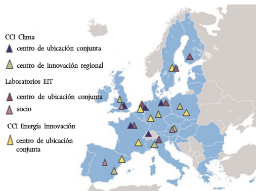
Gráfico 1: Ubicación conjunta de las CCI

Las CCI han seguido distintos enfoques en la elaboración de sus estrategias y estructuras de gobernanza, lo que refleja los distintos ámbitos temáticos. Una CCI ha sido creada como empresa, mientras que otras dos son asociaciones sin ánimo de lucro. Todas están estructuradas en torno a unos treinta socios principales y cinco o seis centros de ubicación conjunta, que normalmente están acompañados por un número variable de socios afiliados adicionales entre los que se encuentran pequeñas y medianas empresas (PYME).