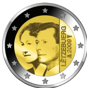
National side of the new 2-euro commemorative circulation coin issued by Luxembourg

Euro coins intended for circulation are legal tender throughout the euro area. For the purpose of informing the public and all parties involved who handle the coins, the Commission publishes a description of the designs of all new coins (1) . In accordance with the Council conclusions of 8 December 2003 (2) , euro-area Member States and those countries that have concluded a Monetary Agreement with the Community providing for the issuing of euro coins intended for circulation are allowed to issue certain quantities of commemorative euro coins for circulation, on condition that not more than one new coin design is issued per country per year and that only the 2-euro denomination is used. These coins have the technical features of normal euro circulation coins, but bear a commemorative design on the national side.