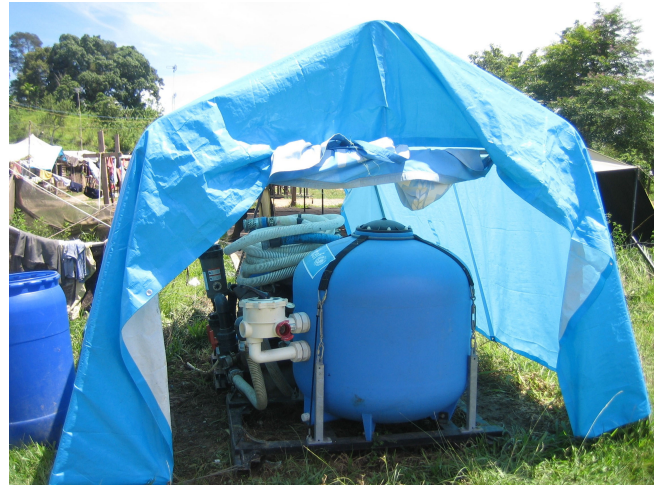
Μονάδα επεξεργασίας ύδατος στην Ατσέ, Ινδονησία

39. Επίσης, ο έλεγχός μας επιβεβαίωσε τις εκθέσεις παρακολούθησης της ΓΔ ECHO, σύμφωνα με τις οποίες οι δράσεις που χρηματοδότησε η ΓΔ ECHO ήταν γενικά αρκετά ορατές, μολονότι σε ορισμένες περιπτώσεις υπήρχε περιθώριο βελτίωσης. Παραδείγματος χάρι, η δράση της ΓΔ ECHO ήταν ελάχιστα ορατή στο κέντρο παιδικής μέριμνας στην Ατσέ (Jantho) και στο σχέδιο για τις μονάδες επεξεργασίας ύδατος που υλοποίησε μια υπηρεσία των ΗΕ. Κατά την ανάλυση της συνολικής διεθνούς βοήθειας, οι αρχικές διαπιστώσεις του συνασπισμού αξιολόγησης για το τσουνάμι (TEC) επικρίνουν τις ανθρωπιστικές υπηρεσίες διότι επικεντρώθηκαν στην πρόωση του ονόματός τους και στο συναγωνισμό για ορατές δράσεις εις βάρος της κάλυψης των πραγματικών αναγκών των δικαιούχων. Εντούτοις, οι δράσεις που γίνονται ικανοποιητικά ορατές διαθέτουν το πρόσθετο πλεονέκτημα ότι βοηθούν στη μείωση του κινδύνου διπλής χρηματοδότησης, διότι καθιστούν δυνατό τον εντοπισμό της πηγής και του αντικειμένου της χρηματοδότησης.