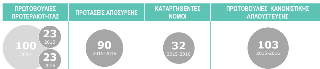
Διάγραμμα 1. Βελτίωση της νομοθεσίας σε αριθμούς κατά την περίοδο 2015-16

Ταυτόχρονα, ο αριθμός των προτάσεων κανονισμών και οδηγιών που υπέβαλε η Επιτροπή προς έγκριση στο Ευρωπαϊκό Κοινοβούλιο και το Συμβούλιο στο πλαίσιο της συνήθους νομοθετικής διαδικασίας μειώθηκε από 159 το 2011 σε 48 το 2015. Από το 2000, ο αριθμός των οδηγιών και των κανονισμών που εγκρίθηκαν από το Κοινοβούλιο και το Συμβούλιο στο πλαίσιο της συνήθους νομοθετικής διαδικασίας ποικίλλει κάθε χρόνο, με υψηλότερο επίπεδο παραγωγής 141 νομοθετικές πράξεις το 2009. Το 2015, πρώτο έτος ανάληψης καθηκόντων από την Επιτροπή Juncker, εγκρίθηκαν 56 νομοθετικές πράξεις.