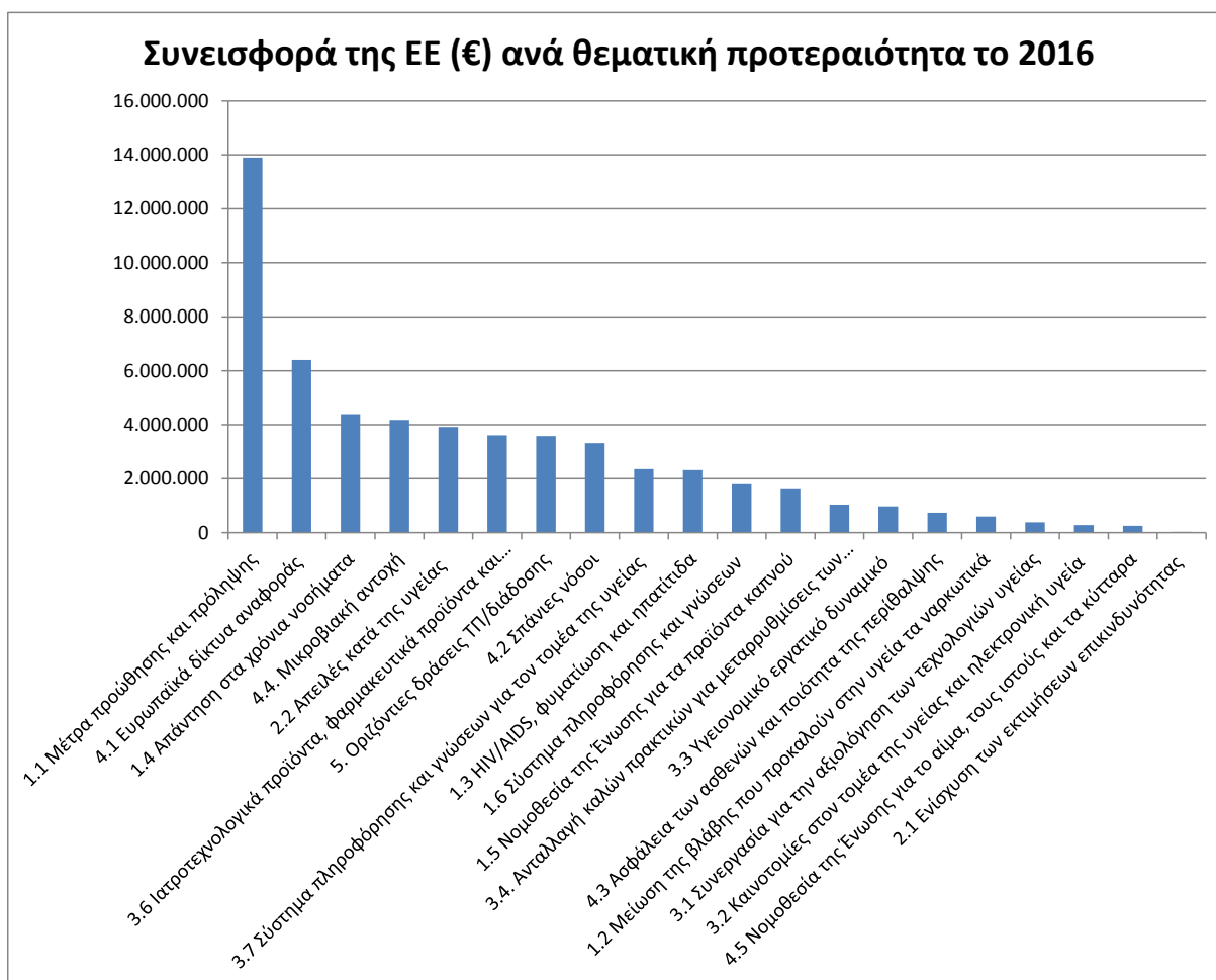
Σχήμα 2: Επιχειρησιακός προϋπολογισμός ανά θεματική προτεραιότητα το 2016

Για την επίτευξη των εν λόγω στόχων, το πρόγραμμα περιλαμβάνει ευρύ φάσμα χρηματοδοτικών μέσων. Αυτά συμπεριλαμβάνουν: