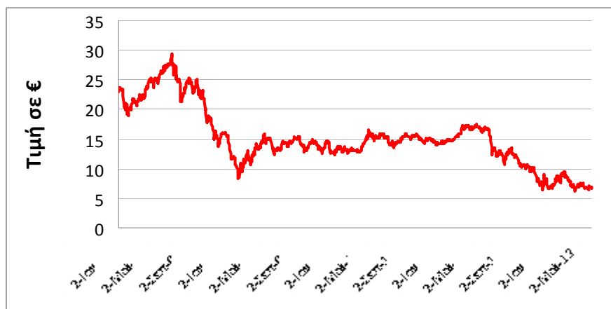
Σχήμα 1: Εξέλιξη των τιμών δικαιωμάτων εκπομπής διοξειδίου του άνθρακα

Στοιχεία για συμβόλαια προπώλησης ενός έτους για παράδοση τον Δεκέμβριο.