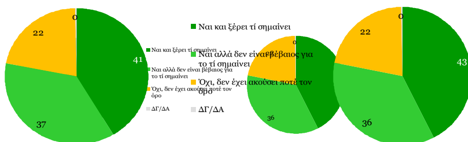
Εξοικείωση με τον όρο «πολίτης της Ευρωπαϊκής Ένωσης», 2007-2010

E1. Η έρευνα αυτή αφορά την ιθαγένεια της Ευρωπαϊκής Ένωσης. Γνωρίζετε τον όρο «πολίτης της Ευρωπαϊκής Ένωσης»;