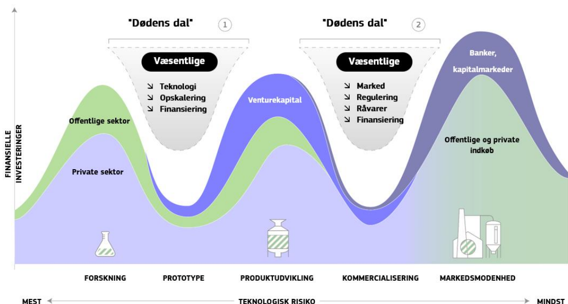
Figur 2: To "dødens dale" ved skalering af bioøkonomien i Europa