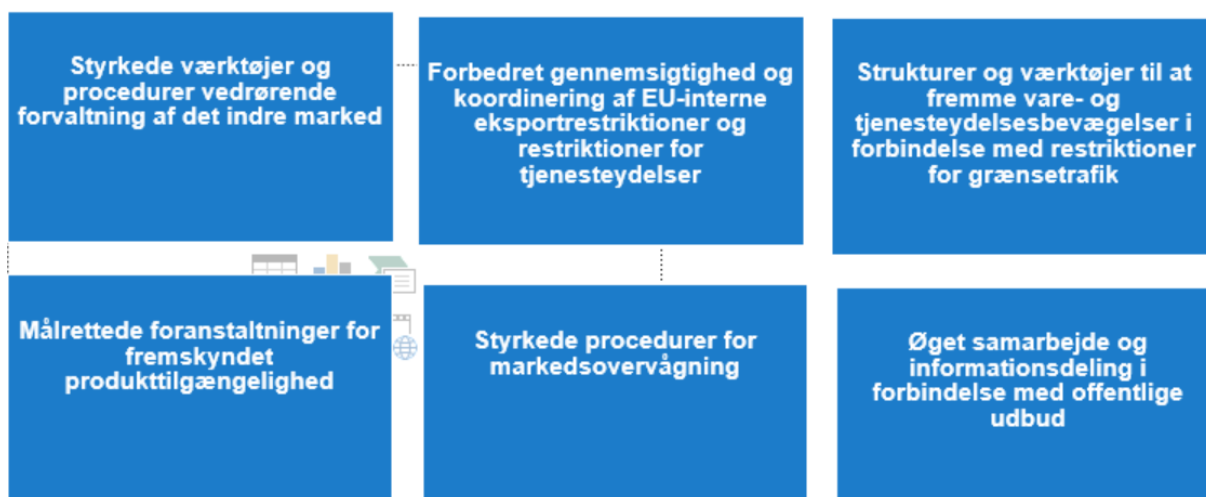
Figur 2 Nøgleelementer i nødinstrumentet for det indre marked

På trods af at de eksisterende redskaber vedrørende det indre marked er nyttige, viste krisen, at de kan forbedres med henblik på nødsituationer. Som kommissionsformand Ursula von der Leyen bebudede i februar 2021 16 , vil Kommissionen foreslå et nødinstrument for det indre marked med henblik på at tilvejebringe en strukturel løsning, der skal sikre tilgængelighed og fri bevægelighed for personer, varer og tjenesteydelser i forbindelse med eventuelle fremtidige kriser. Dette instrument bør sikre mere informationsdeling, koordinering og solidaritet, når medlemsstaterne vedtager kriserelaterede foranstaltninger. Det vil bidrage til at afbøde de negative virkninger for det indre marked, bl.a. ved at sikre en mere effektiv styring. Instrumentet bør også omfatte opbygningen af en mekanisme, som sætter Europa i stand til at afhjælpe kritiske produktmangler ved at fremskynde produkttilgængelighed (f.eks. fastsættelse og deling af standarder, hurtig overensstemmelsesvurdering) og styrke samarbejdet om offentlige udbud. Det vil blive tilpasset relevante politiske initiativer, f.eks. det kommende forslag om oprettelse af EU-Myndigheden for Kriseberedskab og -indsats på Sundhedsområdet (HERA), og den kommende beredskabsplan for transport og mobilitet samt relevant international praksis, der har til formål at håndtere nødsituationer eller sikre og fremskynde adgangen til vigtige produkter.