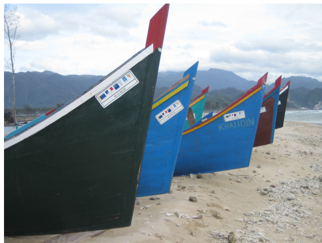
Pomoc s živobytím: rybářské čluny v indonéské provincii Aceh

21. Hodnocení potřeb u projektů schválených od února 2005 byla spolehlivější díky větší dostupnosti informací a skutečnosti, že bylo více času na přípravu návrhů. Jedna nevládní organizace například při přípravě projektu na výstavbu člunů v provincii Aceh úzce spolupracovala s místní komunitou a podařilo se jí navrhnout projekt, který splňuje potřeby příjemců.