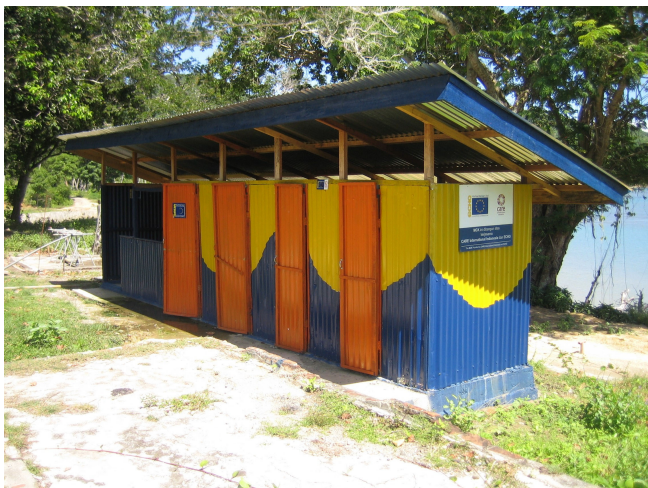
Pomoc se zajišťováním hygieny: latríny v indonéské provincii Aceh

26. Pokud jde o návaznost fáze rekonstrukce, GŘ ECHO pracuje s ostatními útvary Komise na zajištění hladkého a účelného přechodu mezi krátkodobou základní pomocí a dlouhodobější rekonstrukcí. Velká míra finančních prostředků poskytnutých generálním ředitelstvím ECHO pomohla překlenout přechodnou fázi mezi základní pomocí a rekonstrukcí, která byla delší, než se původně očekávalo (viz bod 15a)). Strategie návaznosti základní pomoci, obnovy a rozvoje (LRRD) v Indonésii a na Srí Lance zahrnuje rovněž využití mechanismu rychlé reakce, který zajišťuje satelitní snímky škod způsobených cunami, jež mohou být užitečné pro plánování rekonstrukce a připravenost na katastrofy. Mechanismus rychlé reakce rovněž pomáhal financovat vyjednávací iniciativy, které v srpnu 2005 vedly k mírové dohodě mezi indonéskou vládou a Hnutím za svobodný Aceh (GAM), a tím posílil základy úsilí o rekonstrukci.