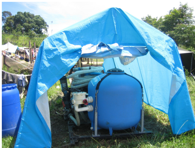
Čistička odpadních vod v provincii Aceh

39. Náš audit také potvrdil monitorovací zprávy GŘ ECHO, v nichž se uvádí, že viditelnost akcí financovaných GŘ ECHO byla obecně uspokojivá, i když v některých případech ještě existoval prostor pro zlepšení. Viditelnost GŘ ECHO nebyla dostatečná například ve středisku pro péči o děti v Jantho v provincii Aceh a v případě čističek vody zajištěných agenturou OSN. V rámci analýzy celkové mezinárodní pomoci kritizuje zpráva o prvotních zjištěních koalice pro hodnocení cunami (TEC) humanitární agentury za to, že se soustřeďují na propagaci své značky a soutěží o zviditelnění na úkor plnění skutečných potřeb příjemců. Akce na zvýšení viditelnosti mají však dodatečný přínos: pomáhají snižovat riziko dvojího financování jasným uvedením poskytovatele finančních prostředků na konkrétní projekty.