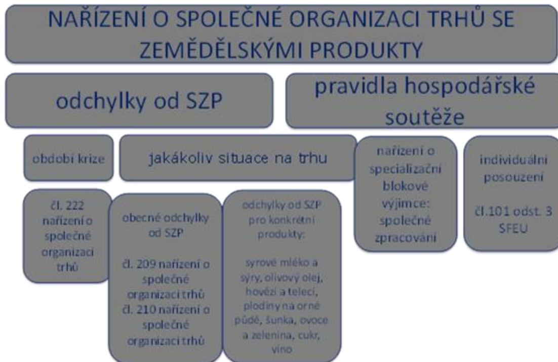
Graf 1 Pravidla hospodářské soutěže před 1. 1. 2018

11. Mnohé z těchto odchylek se vztahují na práci uznávaných organizací producentů, jejichž činnosti jsou popsány v článku 152 nařízení o společné organizaci trhů se zemědělskými produkty; jiné se vztahují na zemědělce a sdružení zemědělců (článek 209) a článek 210 nařízení o společné organizaci trhů se zemědělskými produkty platí pro vertikální spolupráci mezioborových organizací v dodavatelském řetězci.