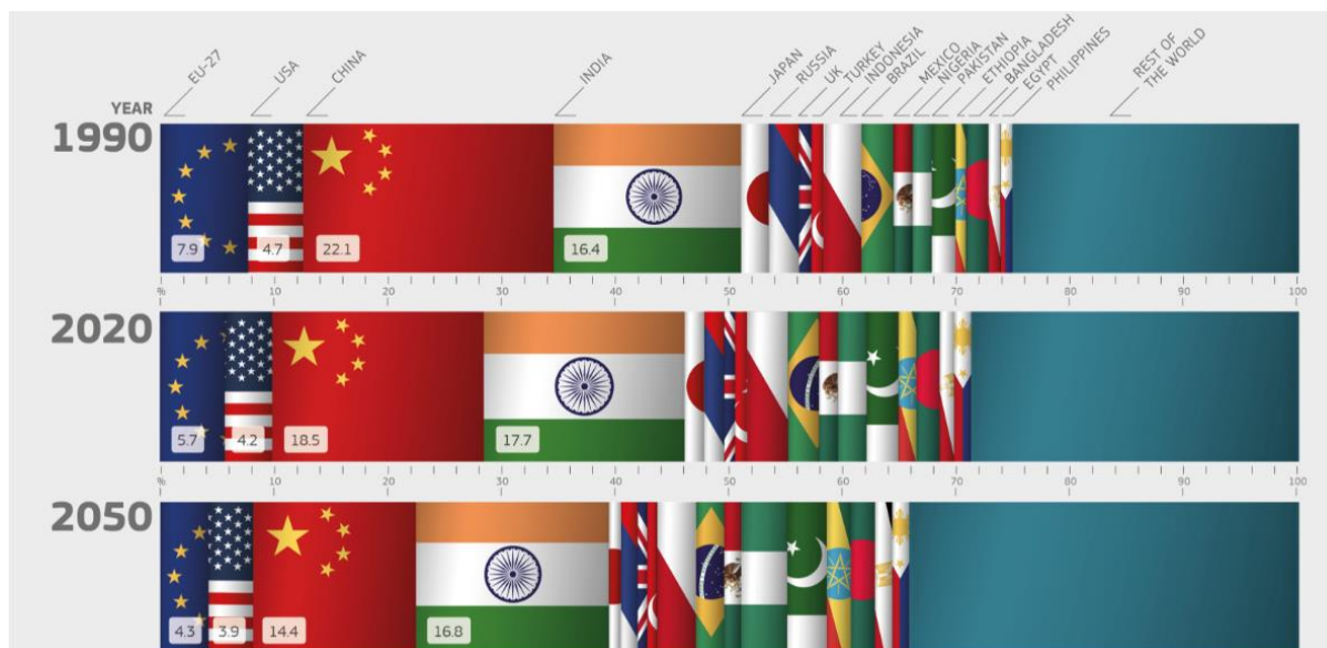
Obrázek 2: Předpokládané podíly celosvětové populace 30

Nadcházející desetiletí se budou vyznačovat dalším přerozdělováním globálních sil, přičemž jejich geoeconomické těžiště se bude přesouvat směrem na východ 31 . Země skupiny G7 (Kanada, Francie, Německo, Itálie, Japonsko, Spojené království, USA) v současné době vytvářejí přibližně 40 % celosvětového HDP, což představuje pokles oproti 60 % v roce 1975 32 . Hospodářská váha „nově se rozvíjejících sedmi – E7“ (Brazílie, Čína, Indie, Indonésie, Mexiko, Rusko, Turecko) se rovná přibližně dvěma třetinám váhy G7. Tento poměr se v období do roku 2050 zvrátí. Do konce tohoto desetiletí se Čína stane největší ekonomikou, přičemž Indie v příštích 20 letech pravděpodobně překoná EU (obrázek 3). Růst HDP v nově se rozvíjejících a rozvojových zemích se zároveň nutně nepromítá do lepší kvality života jejich občanů, a to i v zemích s vysokým HDP na obyvatele 33 . Hlavními výzvami pro rozvíjející se ekonomiky zůstávají velké nerovnosti a nižší ekologické a pracovní normy.