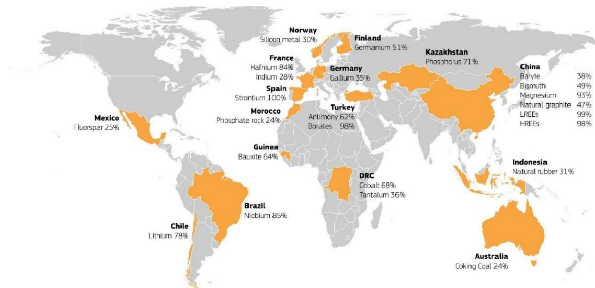
Obrázek 4: Hlavní dodavatelé kriticky důležitých surovin do EU 54

Udržitelnou a rozmanitou nabídku by mohla zajistit inteligentní kombinace průmyslových, výzkumných a obchodních politik s mezinárodními partnerstvími. EU čelí výzvám týkajícím se přístupu, omezené diverzifikace, narušení dodávek a nedostatečných kapacit pro zpracování, recyklaci, rafinaci a separaci. EU se musí připravit na budoucí narušení kritické bezpečnosti dodávek v důsledku hlavních faktorů ovlivňujících geopolitické prostředí: nestabilita států, hospodářské nátlaky a změna klimatu. Ve většině případů má průmysl nejlepší předpoklady k tomu, aby snížil strategické závislosti diverzifikací dodávek, větším využíváním druhotných surovin a nahrazováním. Potenciál diverzifikace dodávek mnoha kritických surovin je však poměrně omezený kvůli geograficky omezeným zdrojům nebo faktickým monopolům či oligopolům. Úsilí průmyslu o zajištění přístupu ke kritickým surovinám a snížení jeho poptávky po nich (vyšší účinností, prodloužením životnosti výrobků a oběhovým hospodářstvím) vyžaduje jasnou dlouhodobou strategii. V neposlední řadě je třeba prozkoumat nové způsoby získávání zdrojů, jako je těžba z mořského dna a vesmírná těžba, v souladu s mezinárodně dohodnutými zásadami a závazky.