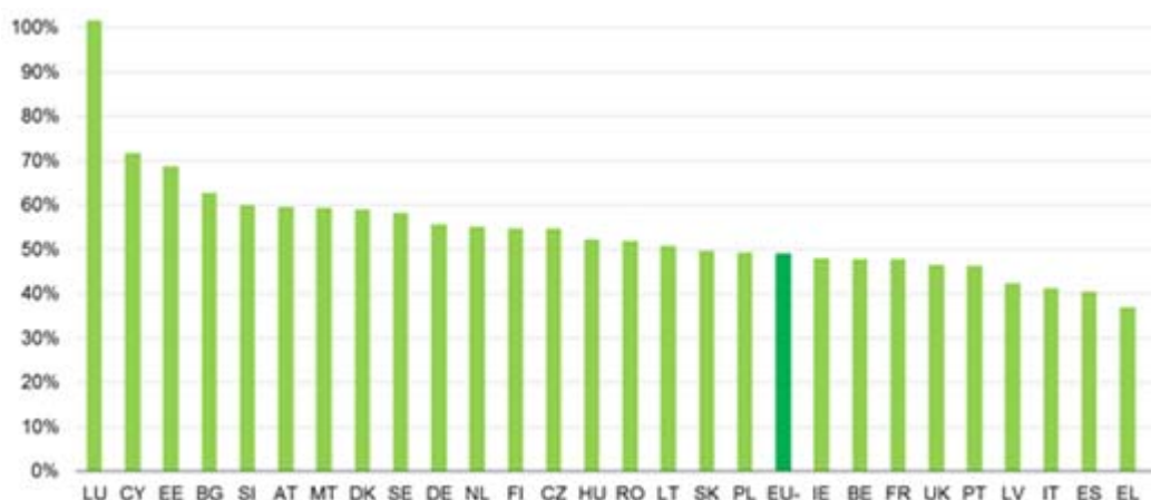
Graf č. 1: Skutečné příjmy z DPH v roce 2011 (v % teoretických příjmů při základní sazbě)

Podíl příjmů z DPH se skládá ze skutečně vybraných příjmů z DPH vydělených součinem základní sazby DPH a čisté konečné domácí spotřeby. Vysokou hodnotu pro Lucembursko lze vysvětlit významem DPH vybrané u prodeje nerezidentům.