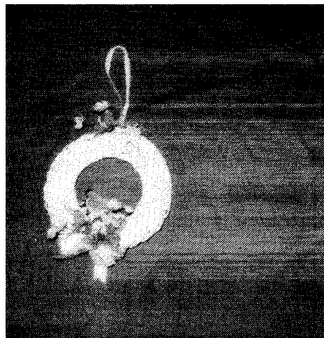
Vzorová fotografie případu č. 3