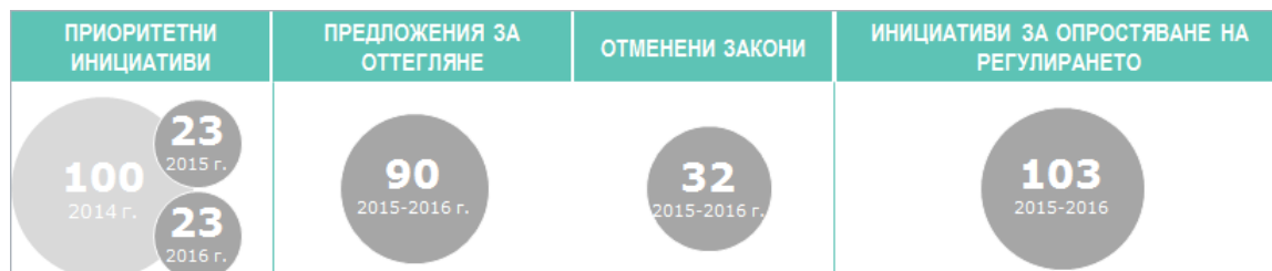
Графика 1. По-доброто регулиране в цифри през периода 2015—2016 г.

В същото време броят на предложенията за регламенти и директиви, изготвени от Комисията за приемане от Европейския парламент и от Съвета по обикновената законодателна процедура, са намалели от 159 през 2011 г. на 48 през 2015 г. От 2000 г. насам броят на директивите и регламентите, приети от Европейския парламент и Съвета в съответствие с обикновената законодателна процедура, варира ежегодно, с най-високо равнище на законодателна дейност (141) през 2009 г. През 2015 г., първата година на Комисията „Юнкер“, бяха приети 56 законодателни акта.