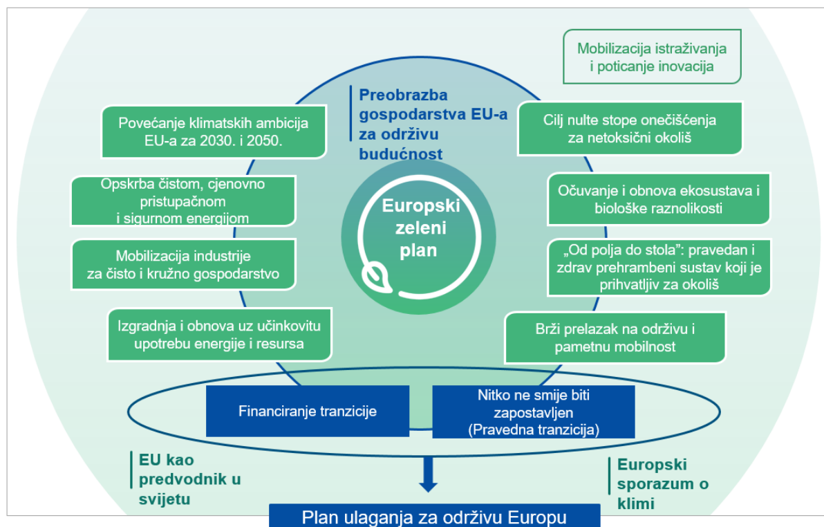
Slika 1. Plan ulaganja u okviru europskog zelenog plana

Plan ulaganja za održivu Europu omogućit će tranziciju prema klimatski neutralnom zelenom gospodarstvu u tri sljedeće dimenzije.