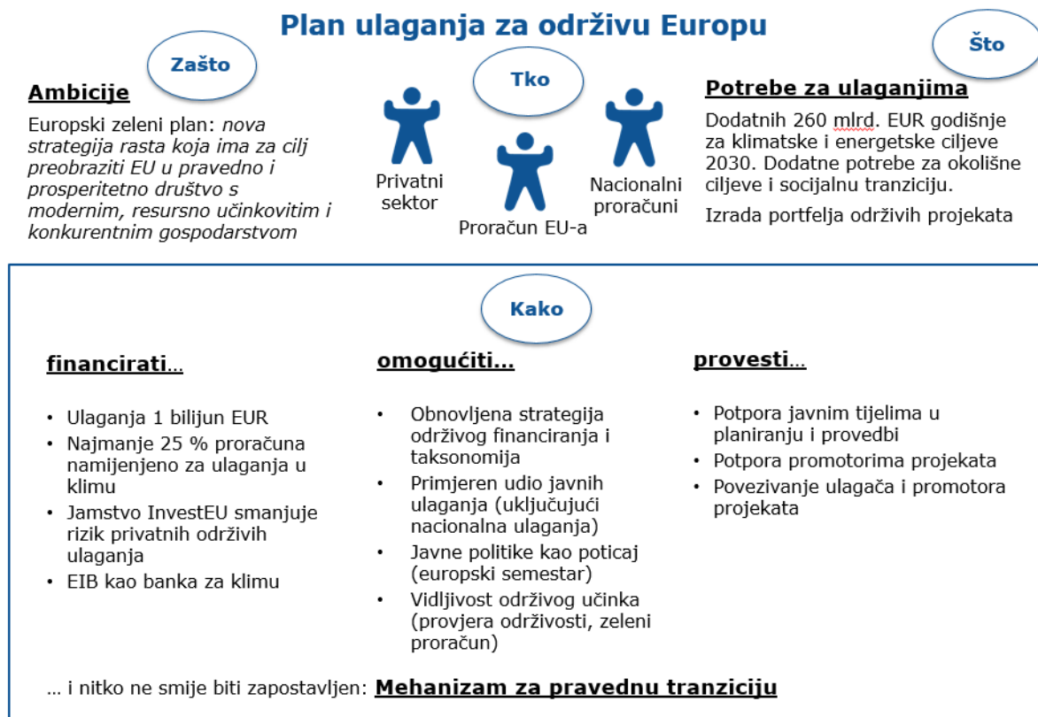
Slika 2. Plan ulaganja za održivu Europu

Plan ulaganja za održivu Europu pridonosi ostvarivanju ciljeva održivog razvoja. To je u skladu s obvezom iz Komunikacije o europskom zelenom planu da će se ciljevi održivog razvoja staviti u središte donošenja politika i djelovanja EU-a.