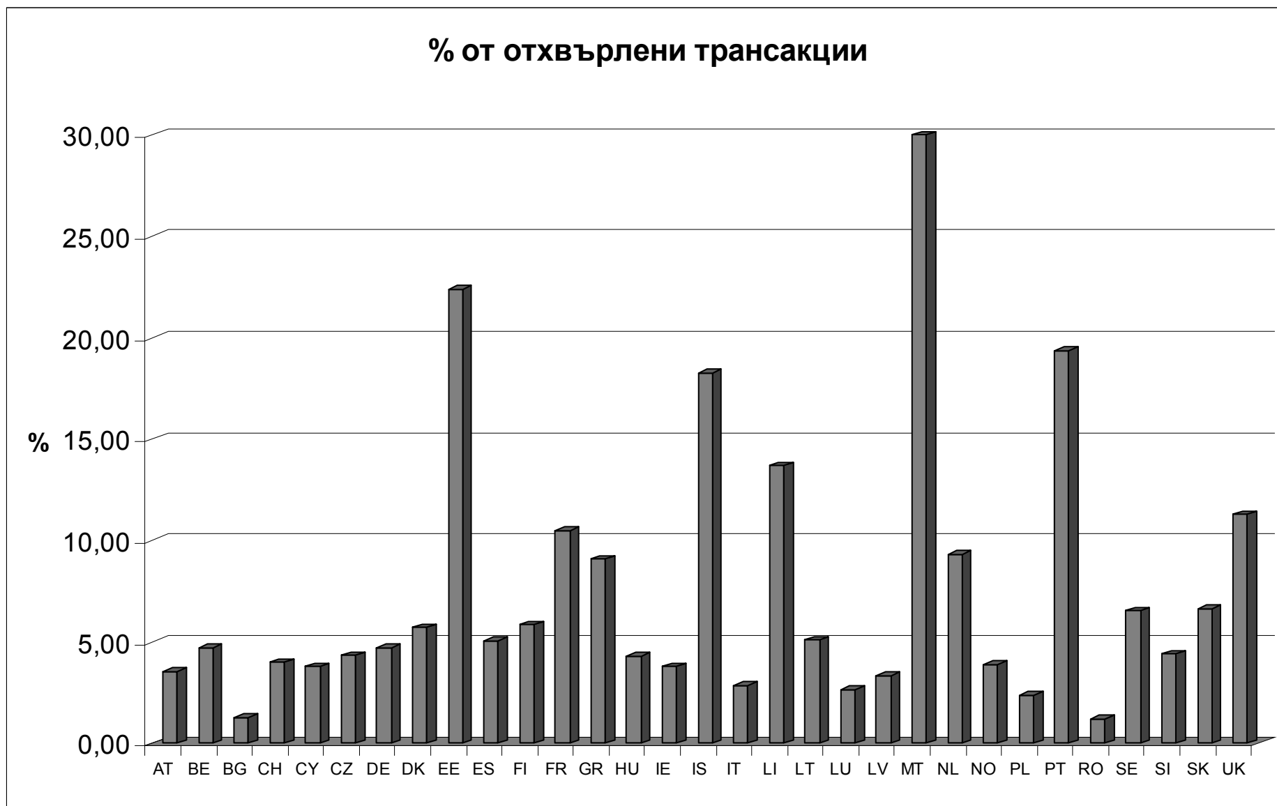
Таблица 8: Отхвърлени трансакции, процент през 2012 г.