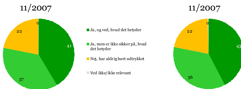
Spm. 1. Denne undersøgelse vedrører unionsborgerskabet. Kender du udtrykket "unionsborger" i Den Europæiske Union? Grundlag: alle adspurgte, % EU27