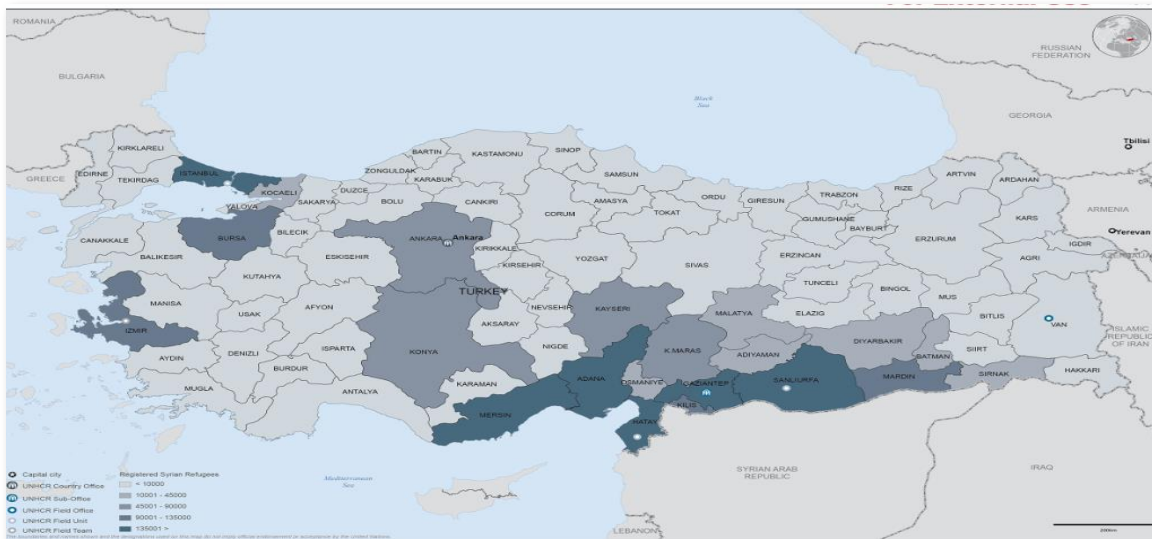
Ripartizione per provincia dei rifugiati siriani in Turchia.

Data la sua posizione geografica, la Turchia è un importante paese di accoglienza e di transito per molti rifugiati e migranti. A seguito di un afflusso senza precedenti, dovuto soprattutto al conflitto in Siria, il paese ospita il numero di rifugiati e migranti più alto al mondo: oltre 3 milioni. Di questi, 2,8 milioni sono rifugiati siriani registrati, il 10% dei quali vive in 26 campi creati dal governo turco nel sud-est del paese, mentre il restante 90% vive fuori dai campi in zone urbane, periurbane e rurali. Per accogliere e ospitare un numero così alto di rifugiati e migranti, la Turchia sta fornendo un generoso sostegno umanitario e finanziario.